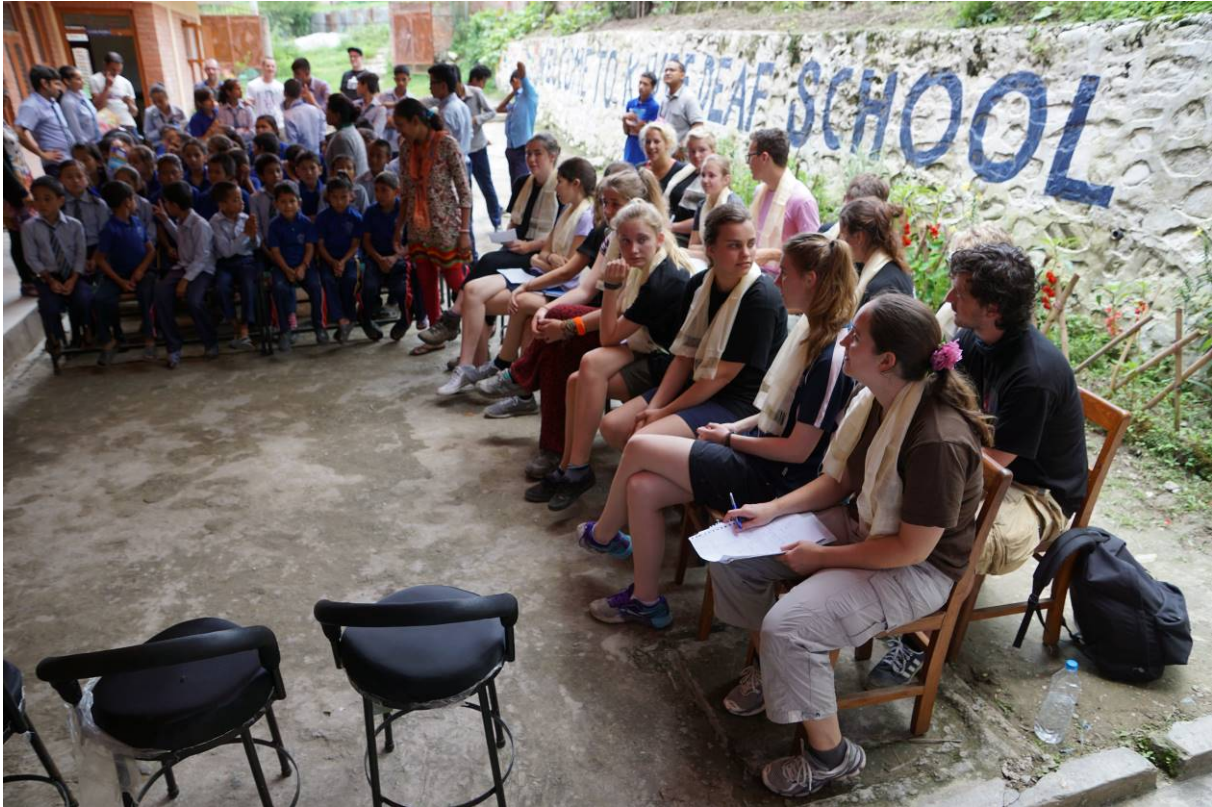
Foto 1: International Youth Award Nederland voor de 3 e keer op projectbezoek. Engelse les en workshops.

Dit project is gestart in 2011 met de schenking van laptops, de aanleg van internet en het verzorgen van lessen Engels aan een dovenschool in Banepa (35 km van Kathmandu). De school, opgericht door de stichting Kumari in Nederland, herbergt ongeveer 80 dove kinderen, deels residentieel. Voor het gebruik van de laptops worden door ons trainingsmaterialen ontwikkeld om plaatselijke docenten te leren hoe de laptops binnen onderwijs kunnen worden benut. Met de aanleg van internet is een wereld ontsloten voor kinderen en docenten om met de buitenwereld te communiceren en nieuwe kennis te verzamelen waardoor het bestaande