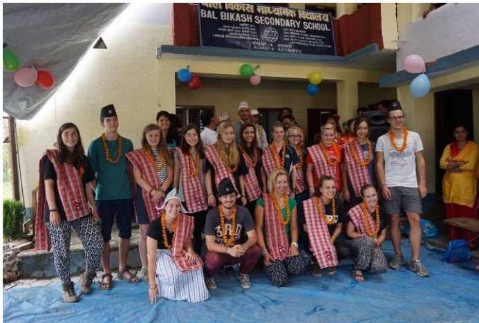
foto 10: De Award Nepal groep 2015 bij de Bal Bikash school in Alapot.

Kenmerkend is dat de laagste kastes nauwelijks kansen krijgen om zich te ontwikkelen (“wie voor een dubbeltje geboren is, wordt nooit een kwartje”). Gelukkig begint er stilaan het besef te komen van de onrechtvaardige werking die uitgaat van dit systeem en trekken de mensen zich het lot aan van de lagere kastes. Zo ook op deze school waar de leerkrachten hun uiterste best doen om bijna 300 kinderen de kans te bieden op onderwijs, ook al moeten ze dat