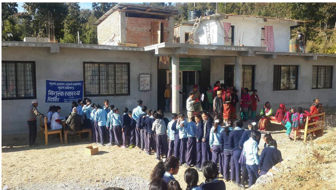
foto 1 Health camps voor schoolgaande kinderen bij de kliniek, projecten die ook door HCH worden mede gefinancierd.

In het Dolakha district ten oosten van Nepal stelt de economische status van de mensen hen niet in staat om in geval van ziekte een ziekenhuis in Kathmandu te bezoeken. In noodgevallen hebben mensen al minstens NR 10.000 (€ 80,-) nodig voor een ambulancerit. Daar komen de kosten voor een doktersconsult, onderzoek en medicatie nog bij. Dit is voor hun onbetaalbaar. Daarom geven de meeste mensen uit de regio er de voorkeur aan om onbetrouwbare, onvoorspelbare en meestal traditionele geneeskundigen te bezoeken. In veel gevallen kunnen eenvoudige en goed te genezen ziektes of infecties hierdoor verergeren en zelfs tot de dood leiden. De sterftelijfers zijn dan ook relatief erg hoog.