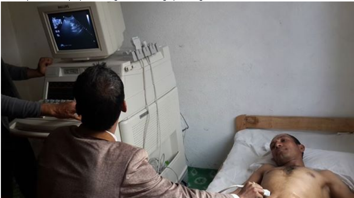
foto 6: training door de Philips instructeur ter plaatse aan de gedoneerde echo apparatuur