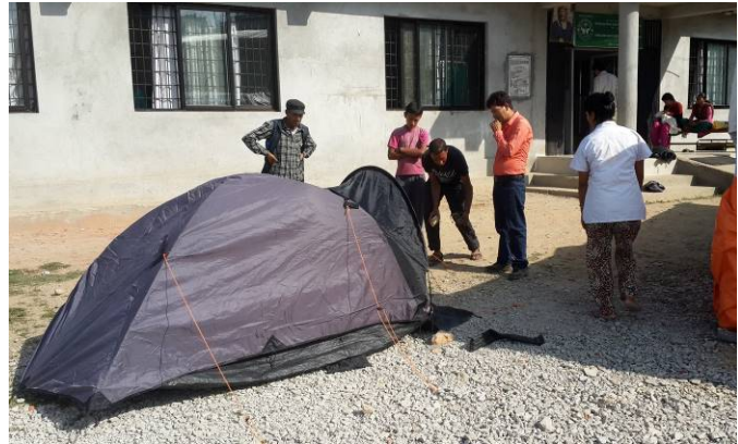
foto 3: opzetten van noodd tenten voor de opvang van gewonden van de aardbevingen

De kliniek is na opening overgedragen aan de plaatselijke Himali Health Cooperative Society, een vereniging met meer dan 200 betalende leden. Het management van de kliniek bestaat op dit moment uit een medisch directeur, die tevens de dienstdoende arts is, een laborant, een radioloog en drie verpleegkundigen. Indien nodig, wordt er aanvullende expertise en capaciteit verleend door het Bir Hospital in Kathmandu, het grootste publieke ziekenhuis in Nepal. De meeste kosten worden gedekt vanuit patiëntbijdragen, waarbij het uitgangspunt is dat de zorg betaalbaar moet blijven en in bijzondere gevallen een beroep kan worden gedaan op het fonds van de vereniging.