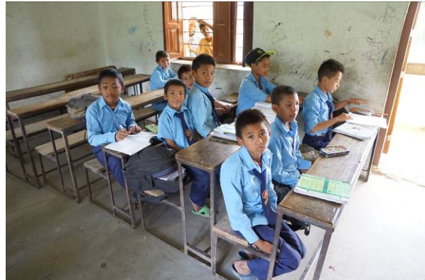
foto 12 Een typisch klaslokaal in Bal Bikash