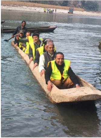
foto 2 Moeilijk te bereiken Sindhupalchowk