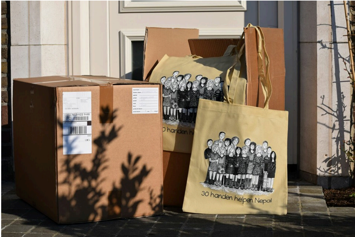
foto 6: een van de acties van de Jeugdkring Chrisko, het vervaardigen en verkopen van boodschappentassen

De Chaula Narayan School kon in 2016 rekenen op wel heel veel belangstelling en steun. Het is een schooltje ten oosten van Kathmandu in het stadje Thali. Het is een kleine school van de lokale Village Development Comité met 45 kinderen en onbruikbaar door de aardbeving. Nu krijgen ze les in voormalige veestallen. De oude school is een spookgebouw, geen glas in de ramen, geen deuren, een lemen vloer en nergens pleisterwerk. Een ander groot probleem is de armoede, waardoor de kinderen geen eten en drinken op de school kan worden aangeboden. Ook van huis nemen ze zelden iets mee. De kinderen van de Chaula Narayan School behoren tot de laagste kasten die in Nepal in relatieve armoede verkeren. De ouders zijn doorgaans niet in staat het weinige geld dat opgebracht moet worden voor schoolkleding, spullen en de lunches op school te bekostigen. De leerkrachten op hun beurt krijgen maar een schamel salaris, maar bekommeren zich met groot enthousiasme om de kinderen. Er is geen geld, er zijn geen boeken, geen bruikbare schoolborden.