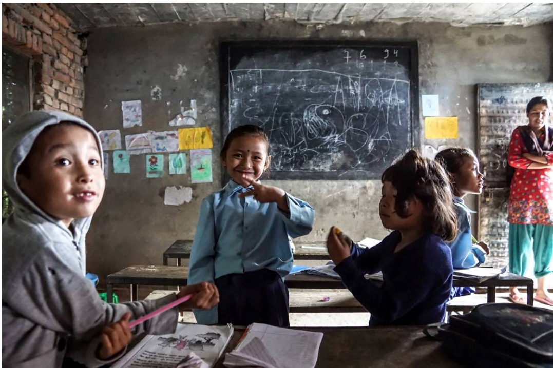
foto 10 Thali school.

De overige boekingen betreffen de in dit jaarverslag beschreven projecten.