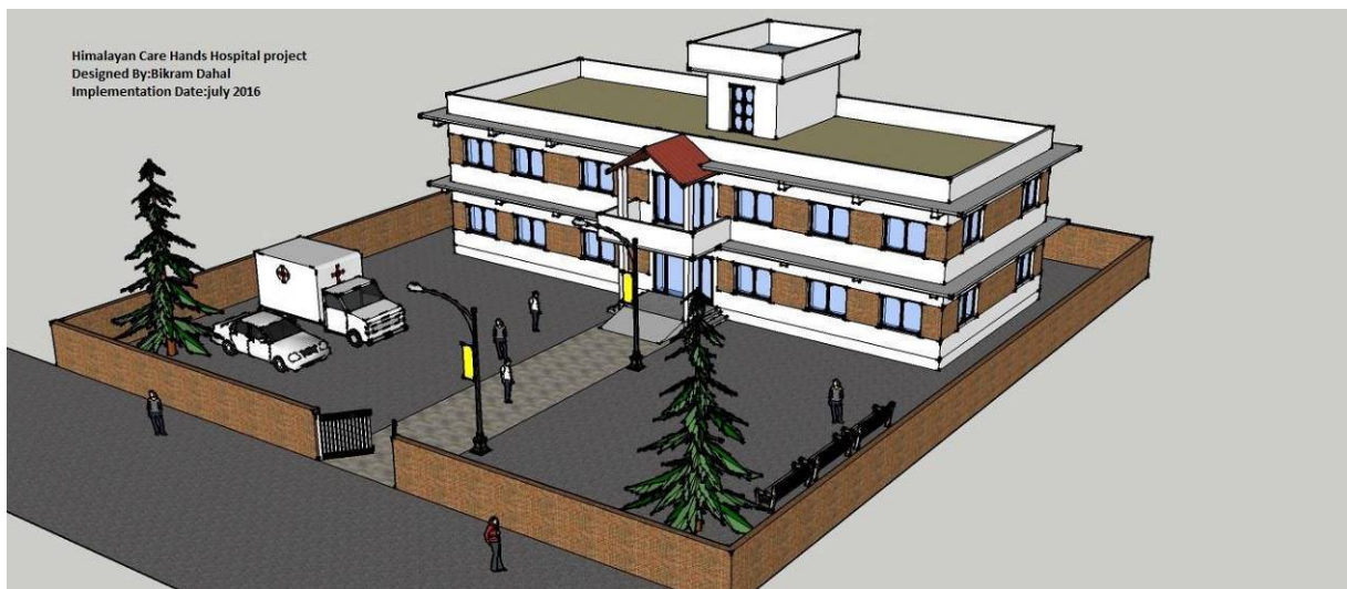
foto 4 Bouwtekeningen uitbreiding HCH ziekenhuis

In 2015 heeft Wilde Ganzen onze uitbreidingsplannen goedgekeurd voor een eerste verdieping en de aanschaf van een ambulance. Daarmee is een bedrag gemoeid van € 78.000 waarvan € 50.000 als bijdrage van onze stichting, Wilde Ganzen en andere Nederlandse en Belgische donateurs. Het resterende deel van de benodigde budget wordt door de lokale vereniging bekostigd. In 2016 is begonnen met de bouw van de eerste etage.