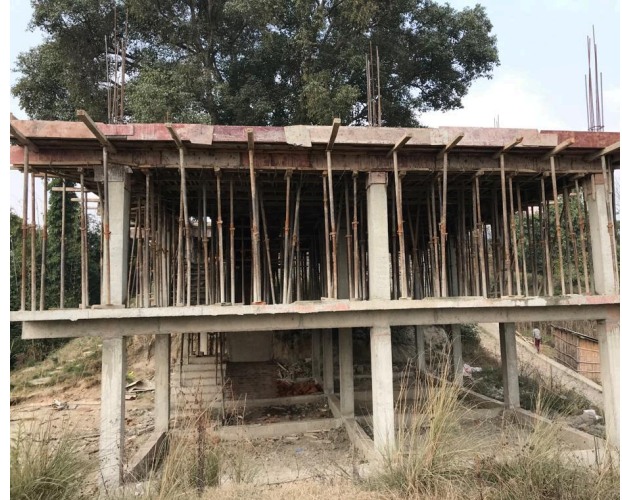
De bouw van het twee verdiepingen tellende schoolgebouw.