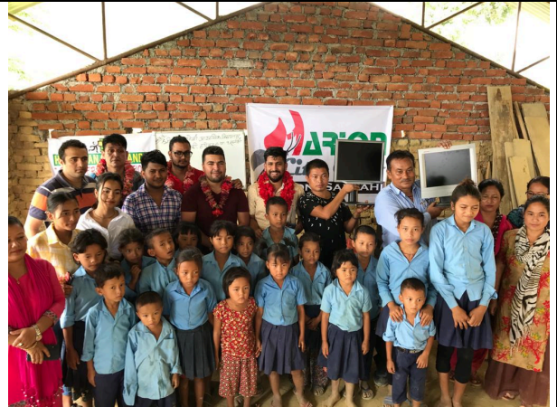
Foto: laptops en pc's voor lagere scholen in het afgelegen Lalbandi in Terai