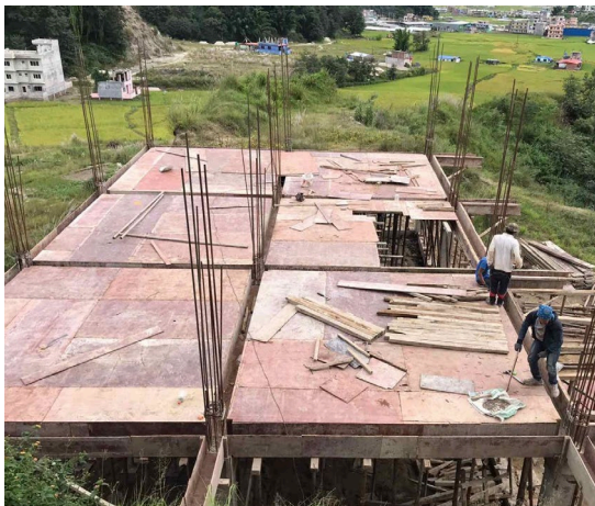
Eind 2019 worden de contouren zichtbaar van het nieuwe schoolgebouw in Thali

Het zogenoemde secondary onderwijs (algemeen voortgezet onderwijs) duurt in Nepal drie jaar. Het is een goede voorbereiding op beroepsonderwijs waarmee de benodigde kwalificaties voor de arbeidsmarkt verworven kunnen worden. Wij vinden dat deze kans ook voor de scholieren van de Chaula Narayan school binnen bereik moet komen. Veel kinderen zijn talentvol en verdienen een kans zich te kunnen ontplooiën. We zijn daarover in gesprek gegaan met de community en de schoolleiding. Daaruit is het plan geboren om de basisschool uit te breiden met drie jaren vervolgonderwijs, op dezelfde wijze en onder vergelijkbare condities als thans het geval is. Dit slaat de brug naar mogelijkheden voor een startkwalificatie om deel te nemen aan beroepsonderwijs of in ieder geval voldoende algemene kennis te verwerven die meer mogelijkheden biedt in de samenleving dan wanneer ze op zeer jonge leeftijd schoolverlaters worden.