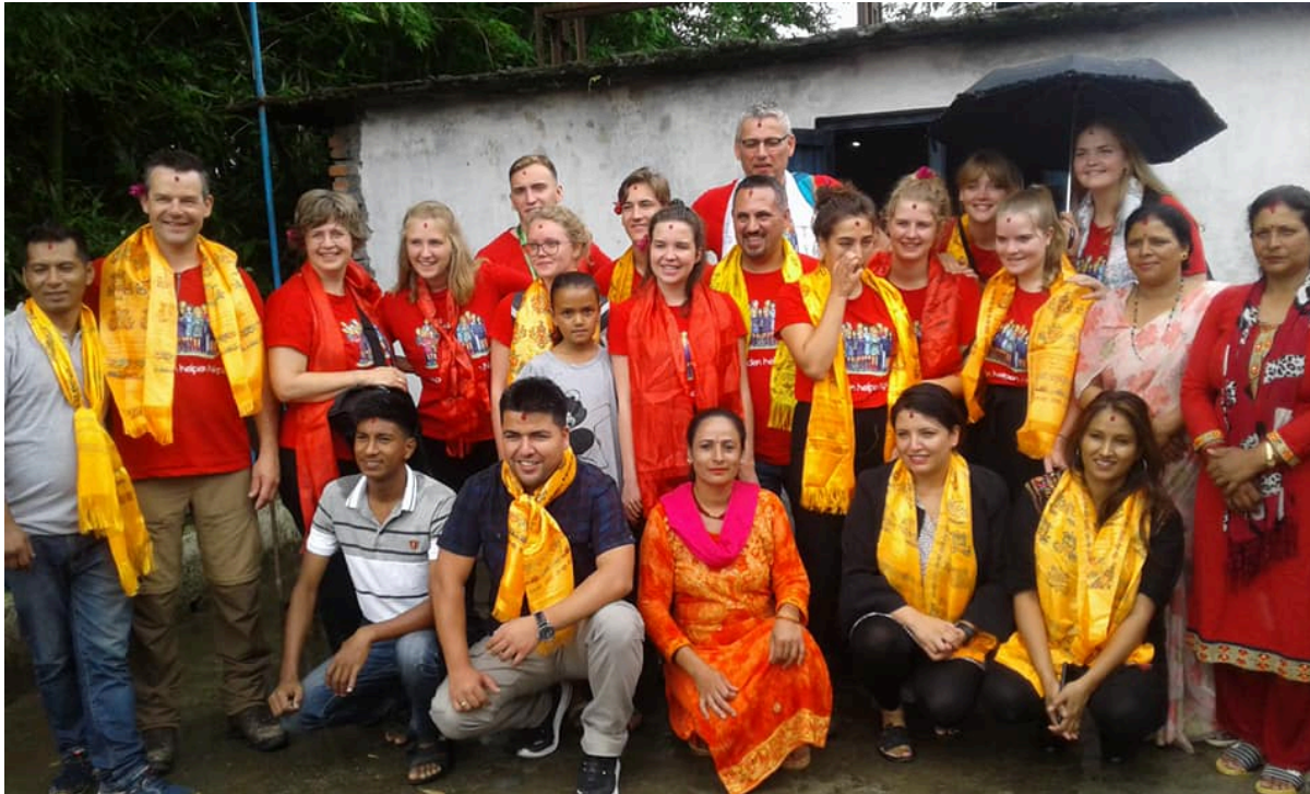
Foto: Jeugdkring Chrisko in 2019 voor de vierde keer in Nepal om de grond bouwrijp te maken voor het nieuwe schoolgebouw. Samen met leerkrachten en bestuursleden van HCH Nepal.