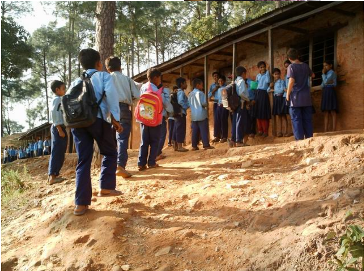
Shree Shankha Devi schoolproject van de stichting Hulp aan Nepal in Jemrung

In juni zijn de stichtingen Hulp aan Nepal ( http://www.hulpaannepal.nl/nepal/ ) en Himalayan Care hands de samenwerking aangegaan om de krachten te bundelen. Aanleiding is dat de stichting Hulp aan Nepal zichzelf gaat opheffen en haar financiële nalatenschap wil overdragen aan een vergelijkbaar opererende stichting voor Nepal.