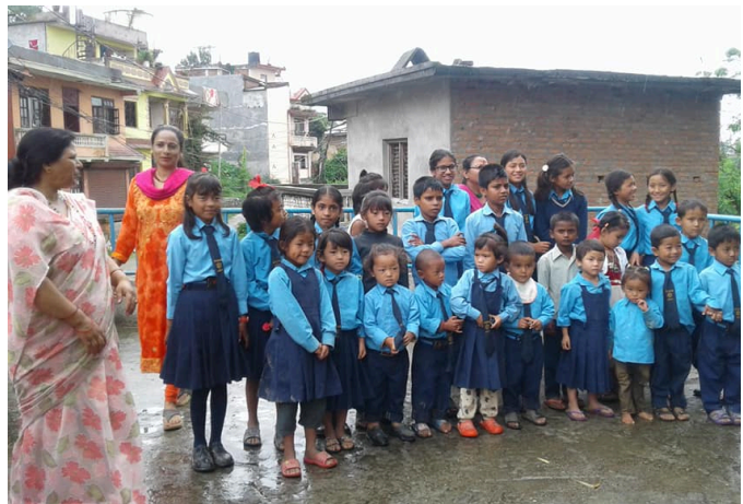
Leerlingen poseren op het dak van het hoofdgebouw in Thali.

Het nieuwe gebouw, dat in 2020 gereed moet komen, bestaat uit 5 klaslokalen, een docentenkamer, bibliotheek/pc/studieruimte en opslagruimte met sanitaire voorzieningen. Alle ruimtes zijn volgens de bouwtekeningen geschikt om primair dienst te doen als klaslokaal bij de verwachte stijgingen van leerlingenaantallen. Het land, de bouwgrond is intussen door de eigenaar geschonken aan de school op voorwaarde dat de bestemming school verwezenlijkt wordt. De Nepalese overheid heeft zich bereid verklaart om na verwezenlijking van het schoolgebouw zorg te dragen voor de werving en salariëring van de benodigde docenten en de school daarmee te erkennen als regulier onderwijs.