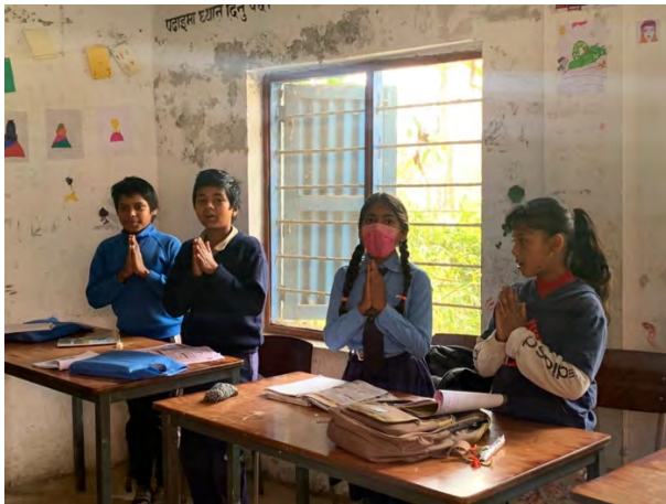
Foto's van de school in Thali