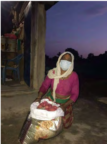
In Gorkha :