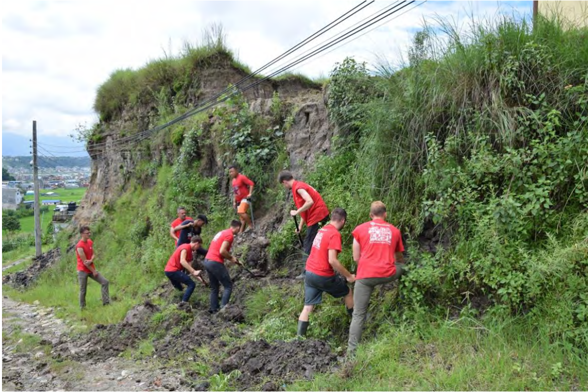
Bouwen aan een keermuur en toegangspad